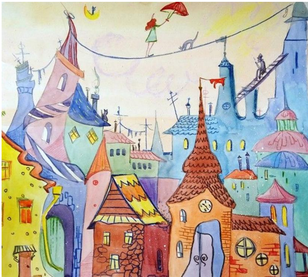
Сказочный город (наглядность)